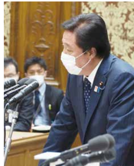
若宮健嗣副大臣の答弁