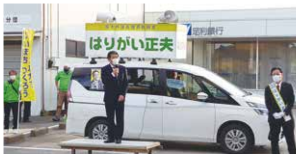
栃木市議選、日光市議選、高根沢町議選で応援演説