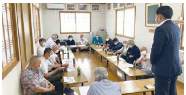
日光市仲町の皆さまと意見交換会