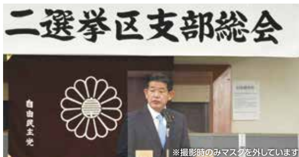
自民党栃木県第二選挙区支部総会