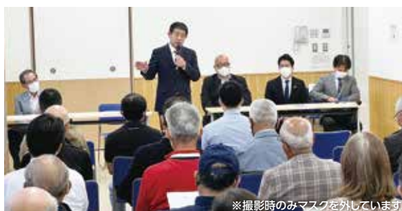
河内地区国政報告会