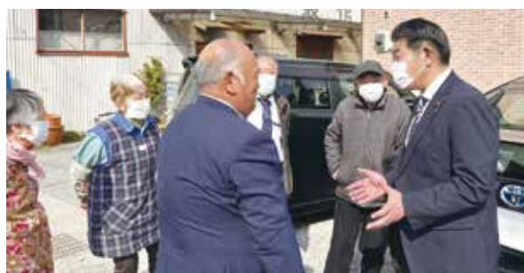
さくら市の皆さまからの要望対応