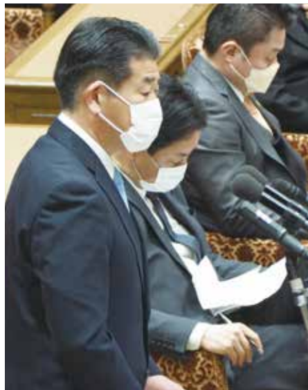
予算委員会での質疑

コロナ禍における「原油価格・物価高騰等総合緊急対策」に基づき、すでにコロナ対策で支出した予備費を補充すること、および6月以降の燃料油価格の激変緩和事業に係る経費の措置等を目的として、5月17日岸田内閣は2兆7009億円の令和4年度補正予算を閣議決定しました。